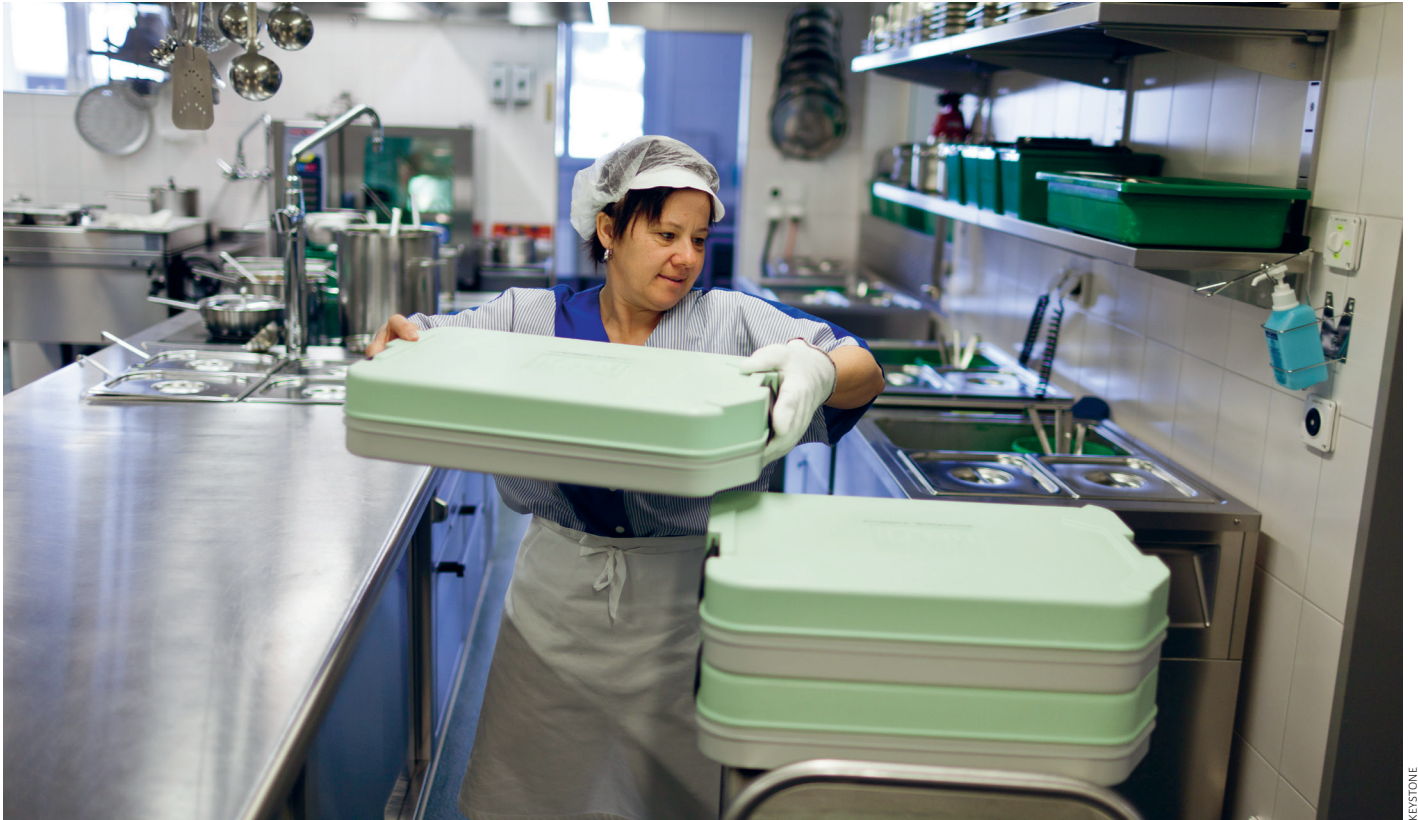
Im Gesundheitswesen steigen die Kosten stark: Spitalküche im bündnerischen Münstertal.

führt insbesondere in der Langzeitpflege zu einem zusätzlichen Kostendruck. Für die Gemeindehaushalte entstehen deutlich weniger Mehrausgaben (+0,4 Prozent des BIP bis 2045). Hier ist die Zunahme von der Langzeitpflege dominiert.